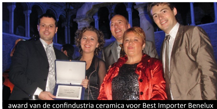
award van de confindustria ceramica voor Best Importer Benelux